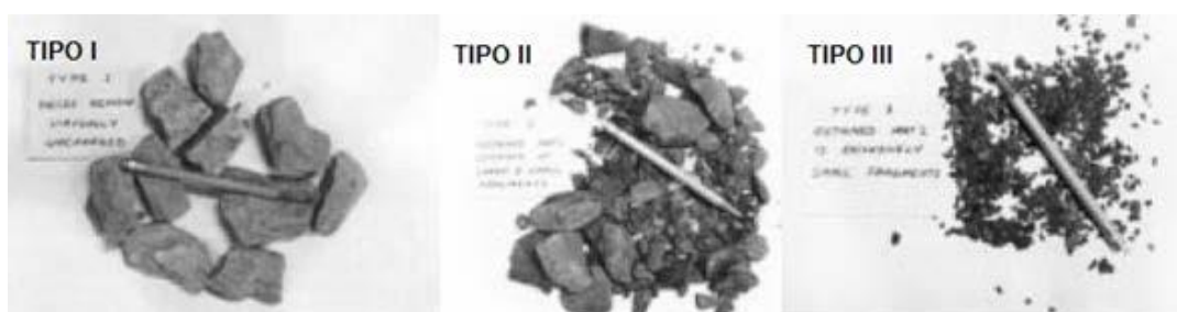
Figura 236 - 3. Tipos de fragmentos retenidos en el tambor